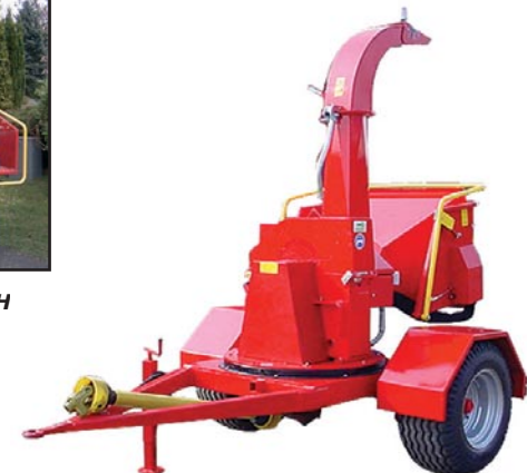
TP carrier 6.5 + TP 250 PH