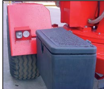
Opties: verlichting voorzijde gereedschapskoffer