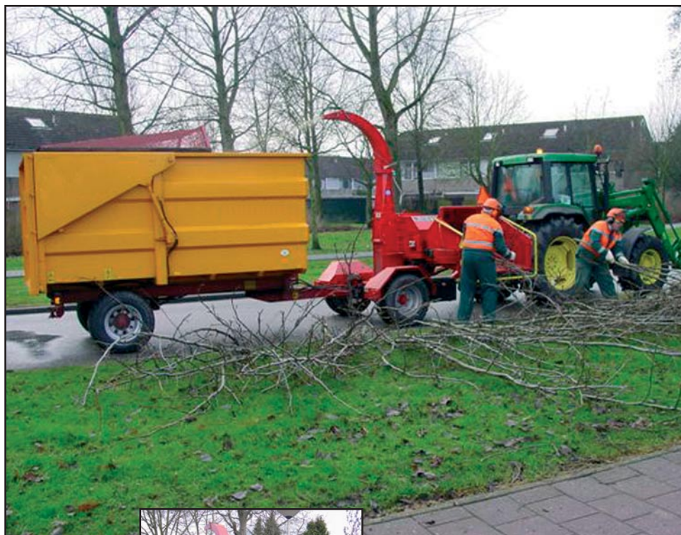
TP carrier 6.5 + TP 250 PH

De aanhangerkoppeling bevindt zeer dicht op de as waardoor een stabiele combinatie gevormd wordt! Geen "geklapper" in de dissel aan de trekkerzijde.