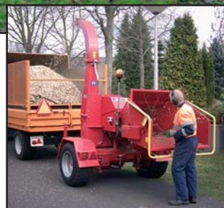
TP carrier 6.5 + TP 250 PH